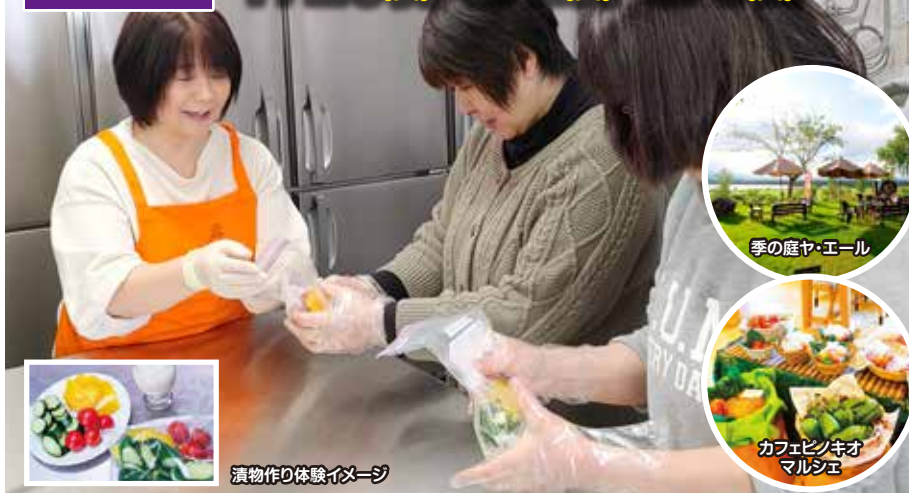
漬物作り体験イメージ