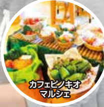
カフェピノキオ マルシェ