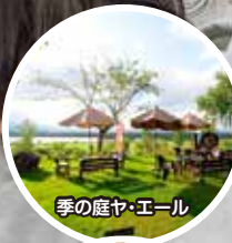
季の庭ヤ・エール